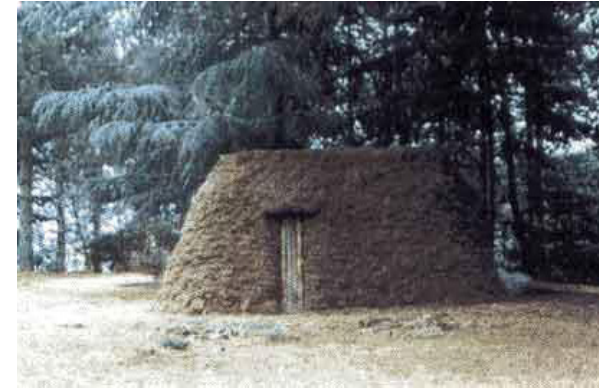
“Museum of coalmen” Cetica, Tuscany, Italy