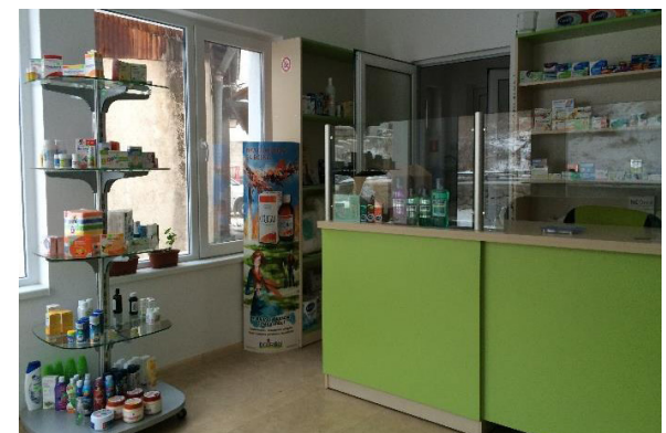
Pharmacy in Kasak, Bulgaria