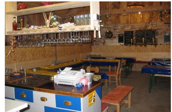
Pizzeria in Kirchdorf, Germany