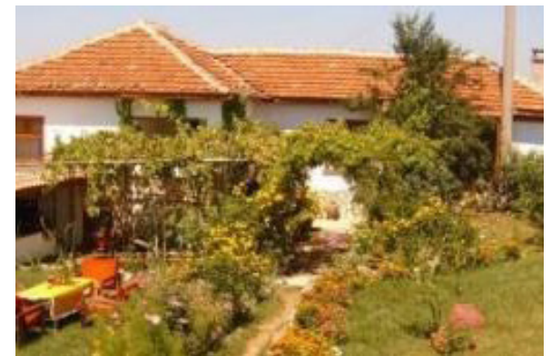
Residential and stable building, "Wild Farm", Gorno Pole, Bulgaria