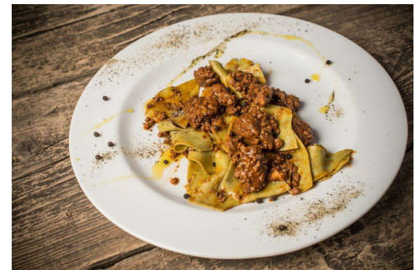
Hosting, direct selling and restaurant "Il Poggiolo" Florence, Italy.