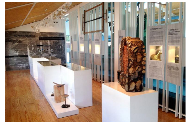
Center for the interpretation of wood culture and a museum, Cazorla, Jaen, Spain.