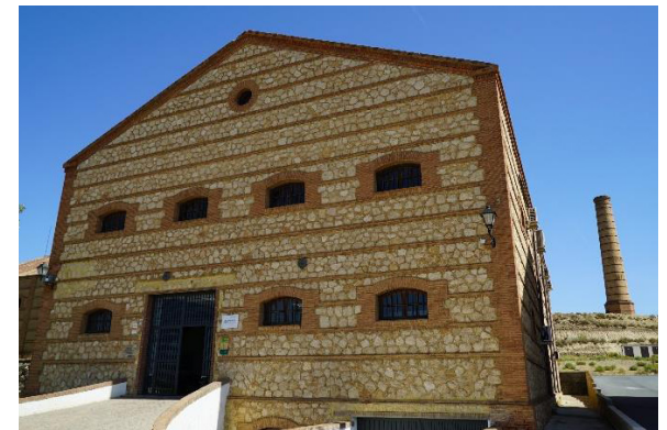
Headquarters of the Rural Development Group of Guadix, Granada, Spain