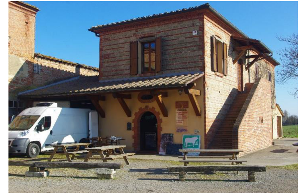
Soc. Agricola Fierli, Siena, Tuscany, Italy.