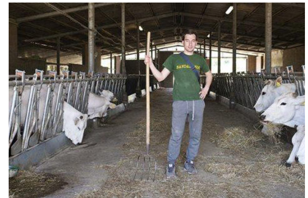
Soc. Agricola Fierli, Siena, Tuscany, Italy.